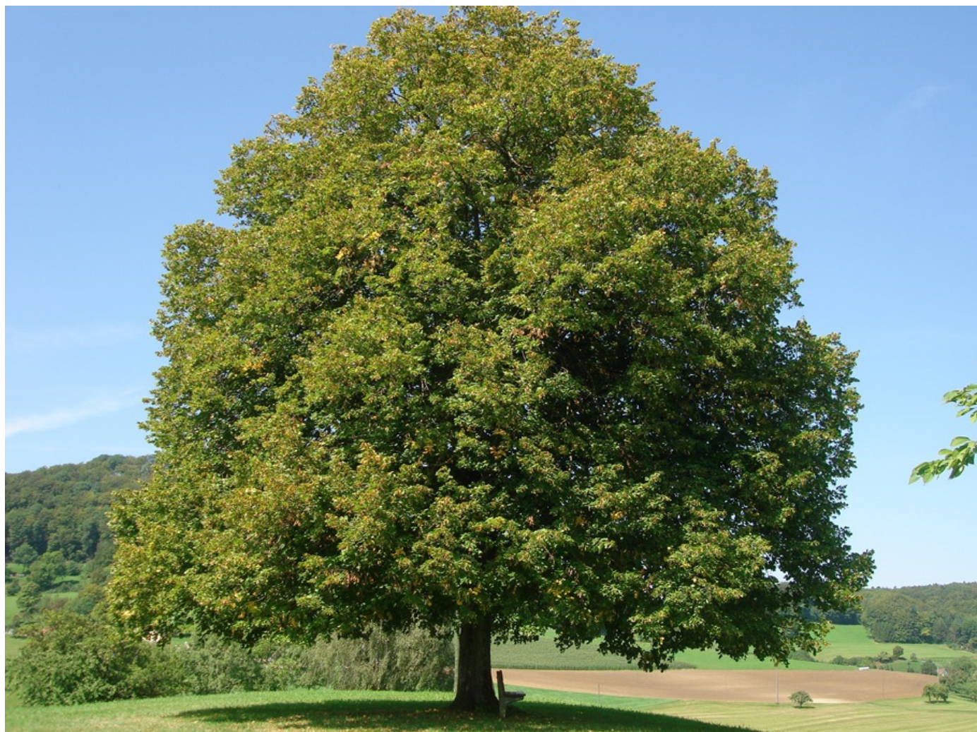
geschützte Linde auf dem Boll

Der Redaktionsschluss ist jeweils am 10. Tag jeden Monats.