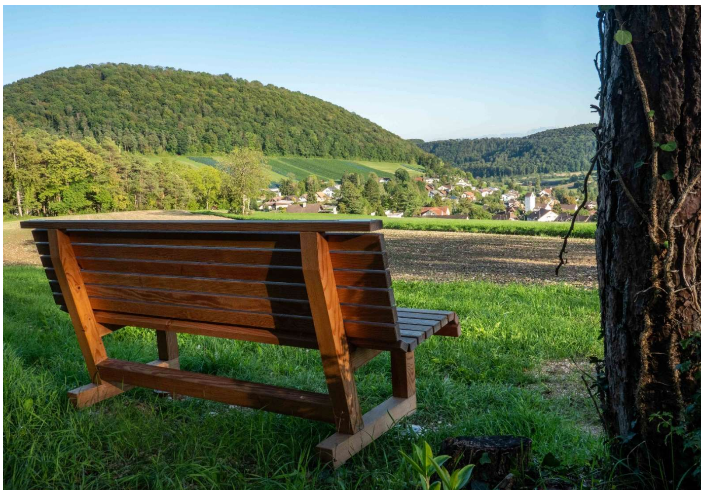
Juraparkbänkli in der Cholrüti

Der Redaktionsschluss ist jeweils am 10. Tag jeden Monats.